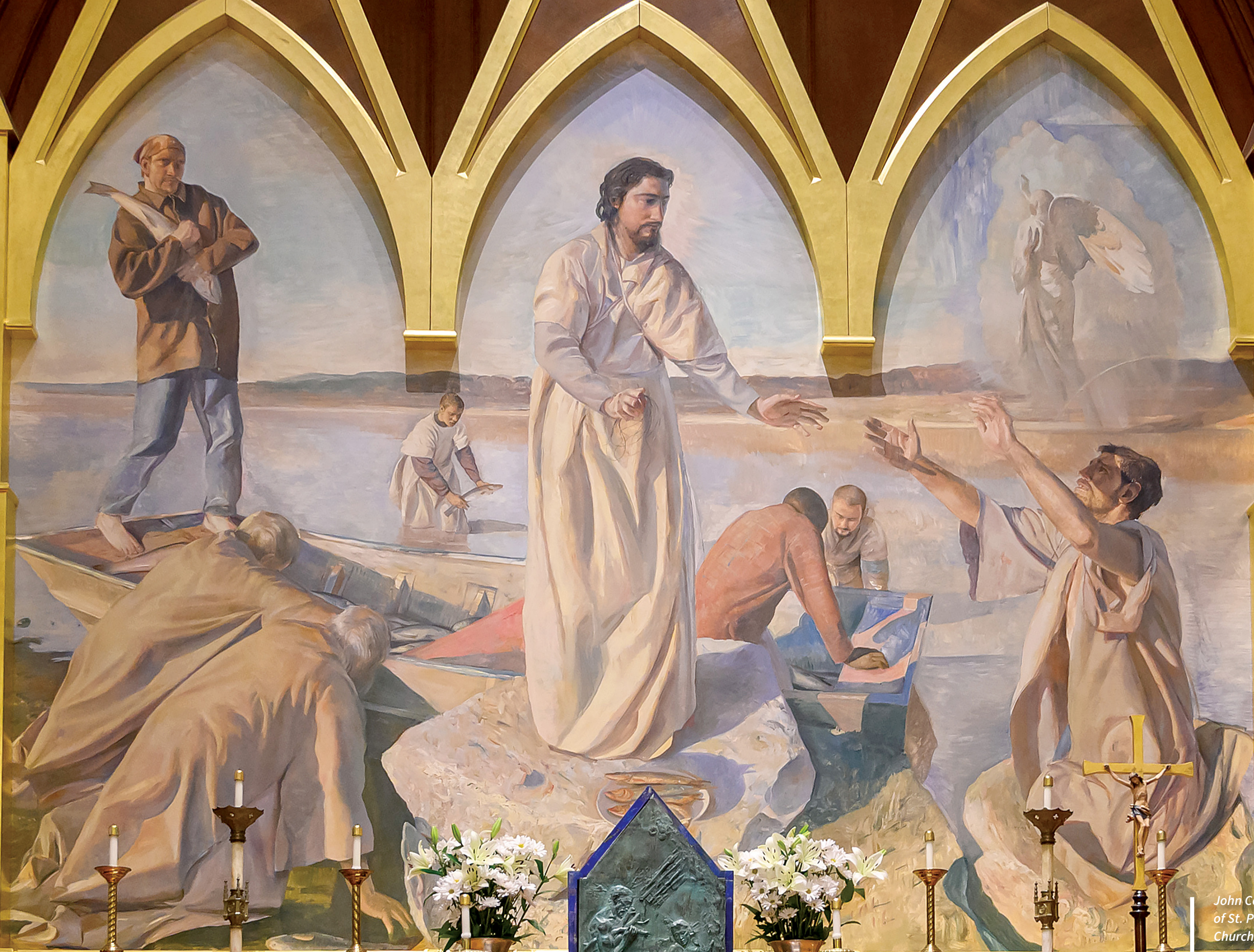
John Collier's "The Repentance of St. Peter," St. Peter Catholic Church, Charlotte, NC